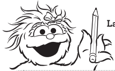
La rutina matutina de Rosita

¿Qué cosas divertidas haces cuando te preparas por la mañana? ¿Qué haces primero? ¿Qué le sigue? Dibuja tu rutina matutina en la tabla y, luego, pégala cerca de tu cama tal como Rosita.